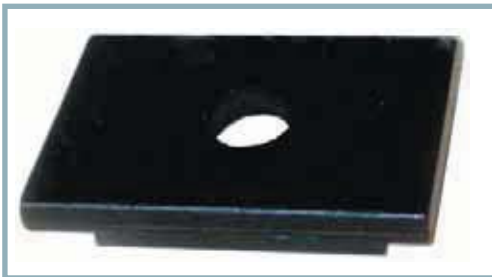
Pressplatta för dornsats